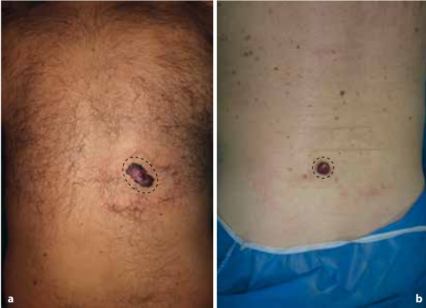
Figura 16.2 Biopsia escisional con margen de 1-3 mm alrededor de la lesión ( línea punteada ), resección quirúrgica con bisturí. a Melanoma extensivo superficial con fase de crecimiento vertical localizado en el dorso, de 4 cm de diámetro mayor. b Melanoma nodular localizado en la región lumbar, de 2 cm de diámetro.