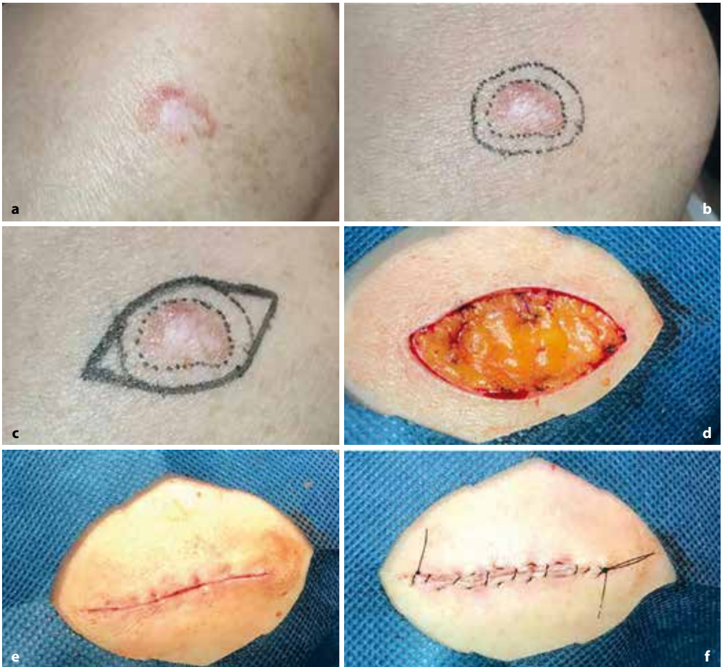
Figura 5.48 Cirugía convencional. a CEC de bajo riesgo localizado a nivel del hombro izquierdo. b Delimitación de margen clínico y margen quirúrgico a 4 mm del anterior. c Diseño en forma de losange para el cierre. d Defecto quirúrgico luego de la incisión y extirpación del tumor. e Cierre afrontando bordes con puntos intradérmicos. f Sutura continua externa con nailon.

El procesamiento del espécimen en parafina y el posterior examen histopatológico pueden requerir algunos días. El informe final realizado por el médico patólogo debe incluir todas las características histopatológicas del CEC ya mencionadas que permiten su categorización y el estado de los márgenes. Si existe compromiso de algún margen debe realizarse un nuevo tratamiento quirúrgico alrededor de la cicatriz, con márgenes más amplios que los iniciales o idealmente con cirugía micrográfica de Mohs. Por el contrario, si los márgenes resultan libres, se debe realizar un control periódico de la cicatriz (y del paciente), ya que el procesamiento habitual en “rebanada de pan” de la pieza operatoria permite el análisis de solo el 1% del margen quirúrgico real.