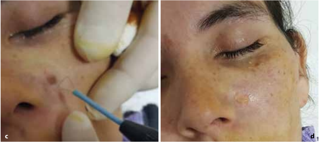
► Figura 15.7 c Remodelado de bordes con radiofrecuencia en punto corte. d Resultado final, antes de la cura plana.