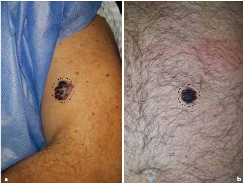
Figura 16.3 Biopsia escisional con margen de 1-3 mm alrededor de la lesión ( línea punteada ), resección quirúrgica con bisturí. a Melanoma extensivo superficial localizado en el brazo, de 2 cm de diámetro mayor. b Melanoma extensivo superficial localizado en el abdomen, de 1,5 cm de diámetro.